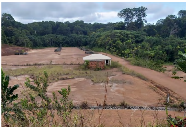
Figure 3. Le site de relocalisation prévu pour Lolabé