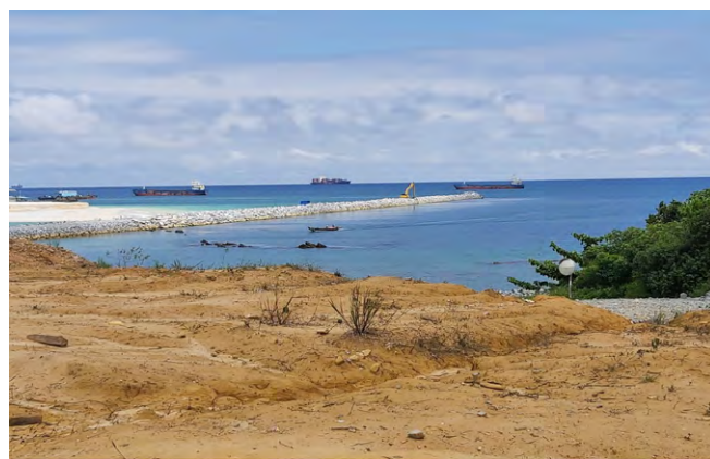
Figure 1. Le port de Kribi au Cameroun en 2021